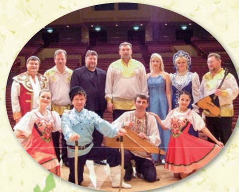
ロシア民族音楽アンサンブル