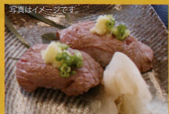
【由利牛の握り】 由利牛の肉汁が食欲をそそります。 一人前 (税込み) ¥400 (数量限定)

●Tel.0120-172-886 ●11:00~22:30 (L.O22:00) ●年中無休