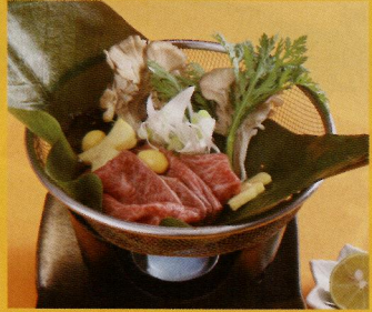
【秋田由利牛と白神舞茸の朴葉みそ焼】 一人前 (税込み) ¥980

●Tel.018-834-7705 ●11:30~14:00 17:00~24:00 ●年中無休