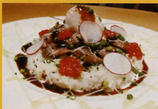
【秋田由利牛ロースのピステッカ】 イタリアと和の融合をお楽しみください。 一人前 (税込み) ¥900

●Tel.018-825-5055 ●11:30~14:30 (L.O14:00)/17:30~22:00 (L.O21:00) ●不定休