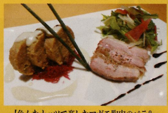
【色々なナッツで楽しむマガモ胸肉のパテ&白神土葱とマガモもも肉のテリーヌ サラダ仕立て】 マガモ2種の部位と白神土葱のコラボレーションをお楽しみください。 一人前 (税込み) ¥900