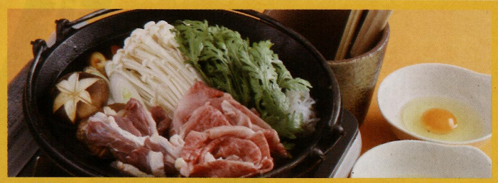
【比内地鶏の卵で食べる秋田由利牛と桜将マガモのすき焼き】 一人前 (税込み) ¥1,000 すきすきビーフ(ム)！君のハートにダック(ジャスト)ミート！！ ランチ、ディナー各10食限定 ご注文は2名様から

●Tel.018-825-1180 ●ランチ(平日) 11:00~15:00 (L.O14:30) (土・日・祝) 11:00~17:00 (L.O16:30) ●ディナー/17:00~23:00 (L.O22:30) ●年中無休