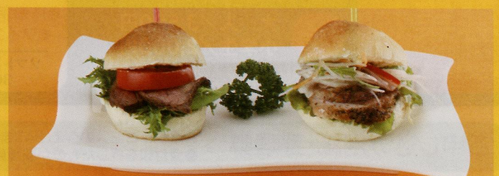
由利牛とマガモのぎゅ〜っと愛してイカメね【パーガーセット】 一人前 (税込み) ¥980 (デザート、ドリンク付)

●Tel.018-834-1518 ●10:00~19:00 (L.O18:00)