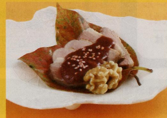
【蒸しマガモの無花果ソース掛け】 一人前 (税込み) ¥680