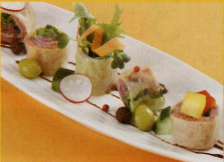
【秋田由利牛ローストビーフの生春巻き】 一人前 (税込み) ¥780

●Tel.018-832-2002 ●昼食(平日) 11:00~15:00 (L.O14:00) (土・日・祝) 11:00~17:00 ●年中無休 ●夕食(平日・土) 17:00~23:00 (L.O22:30) (日・祝) 17:00~22:00 (L.O21:30)