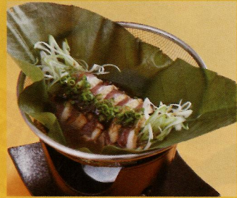
【桜将マガモのネギ朴葉焼】 一人前 (税込み) ¥590